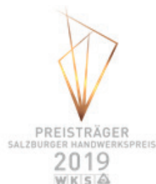
Salzburger Handwerkspreis 2019