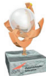
Österreichischer Solarpreis 2019